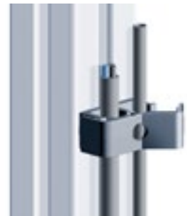
Clip-Kabelbinder mit Hammer Clip Cable Binder with Hammer